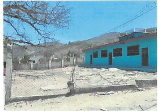
Foto 2: Se reparará el muro perimetral con base de blok y malla con tubo galvanizado y se instalará porton de ingreso.