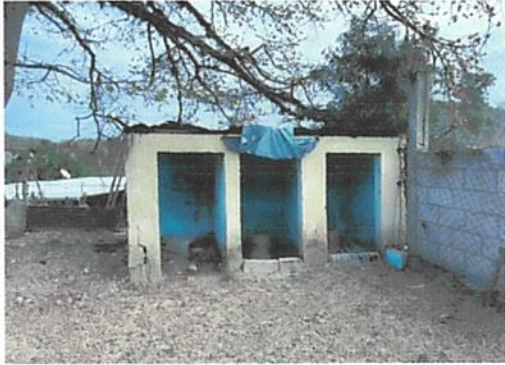
Foto 1: Se remodelará el modulo de sanitarios colocando sanitarios nuevos, lavamanos y se instalará una base metálica con Rotoplas.