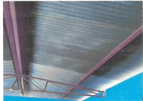
Foto 6: Se dará mantenimiento a la estructura metálica del techo ( pintado y lijado)

Observación: Si es necesario se pueden agregar hojas adicionales y actualizar el número de hojas.